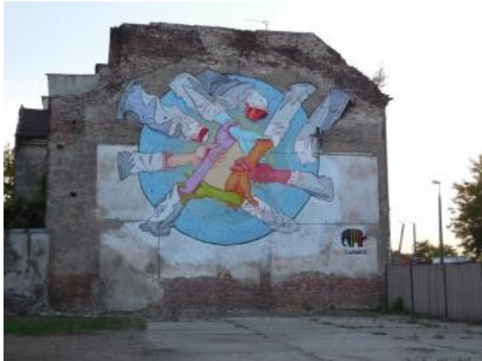
Mural „Weganizm” (czy znasz autora?)