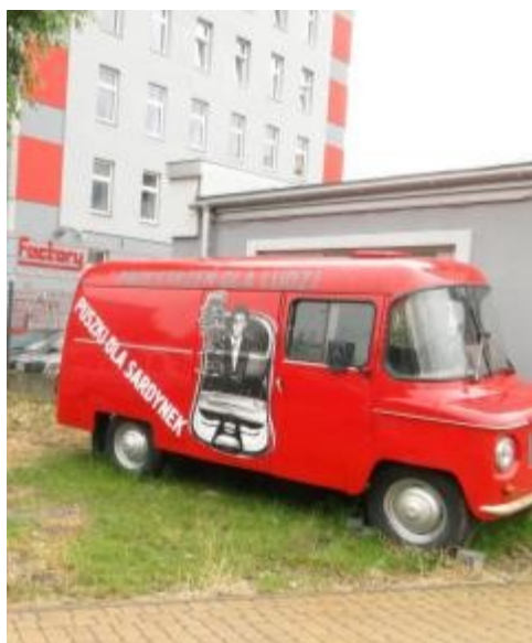
Garden Residence (2010)