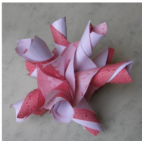
The red-white model from 30 units from Printed Paper (Freudenberger)

Kręciołkowy moduł krawędziowy „Uszy słonia” (a twirl edge module „elephant ears”) 30.07.2009 variant I slamoose