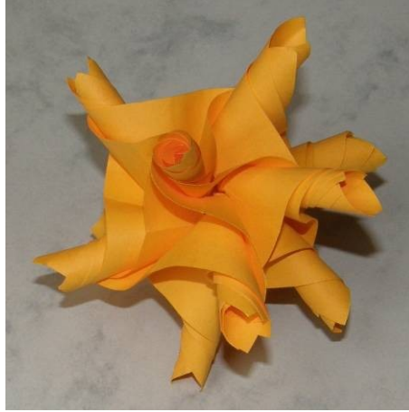
Model from 30 units from Print Paper (Maestro)