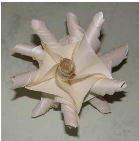
Model from 30 units from StarDream Paper (Opal)