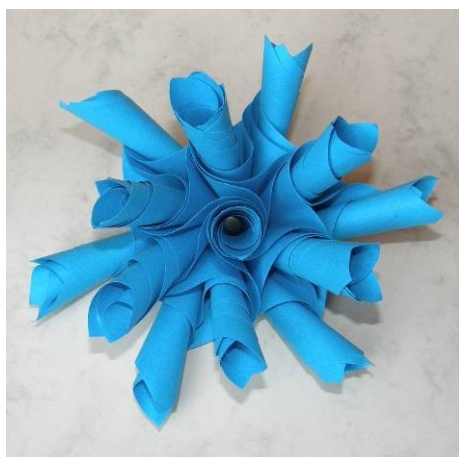
The blue flower from 36 units from Print Paper (Maestro)