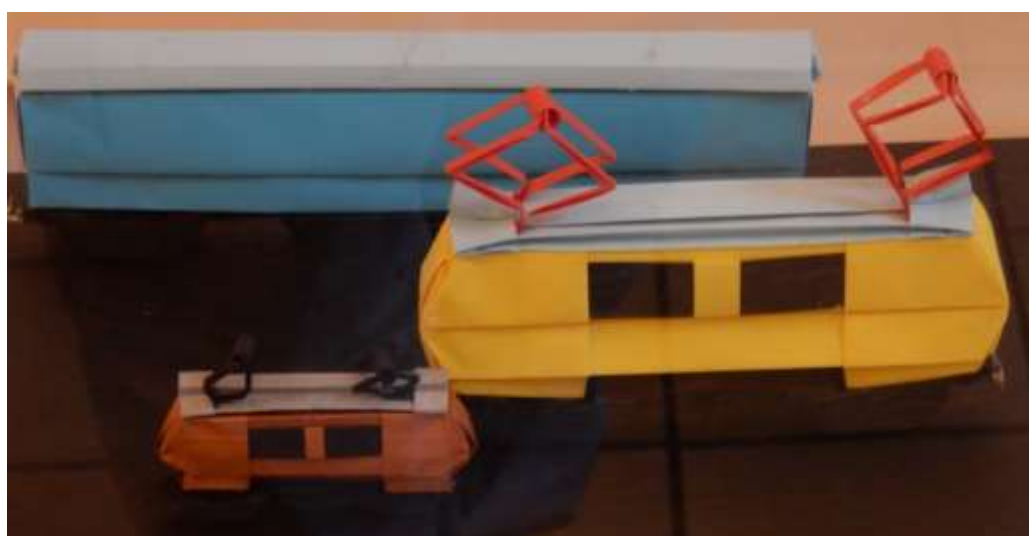
Tomasz Czunko: Lokomotywa elektryczna