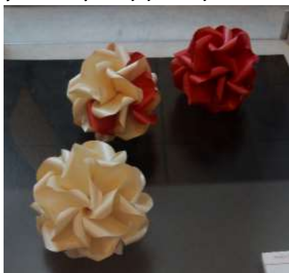
Krystyna Burczyk. Polska dusza