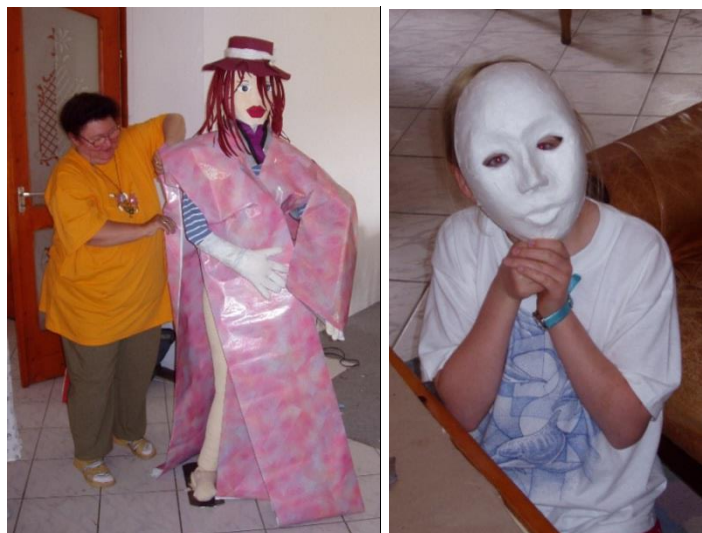
Origami Camp Magyaregregy 2004 – Prawie origami