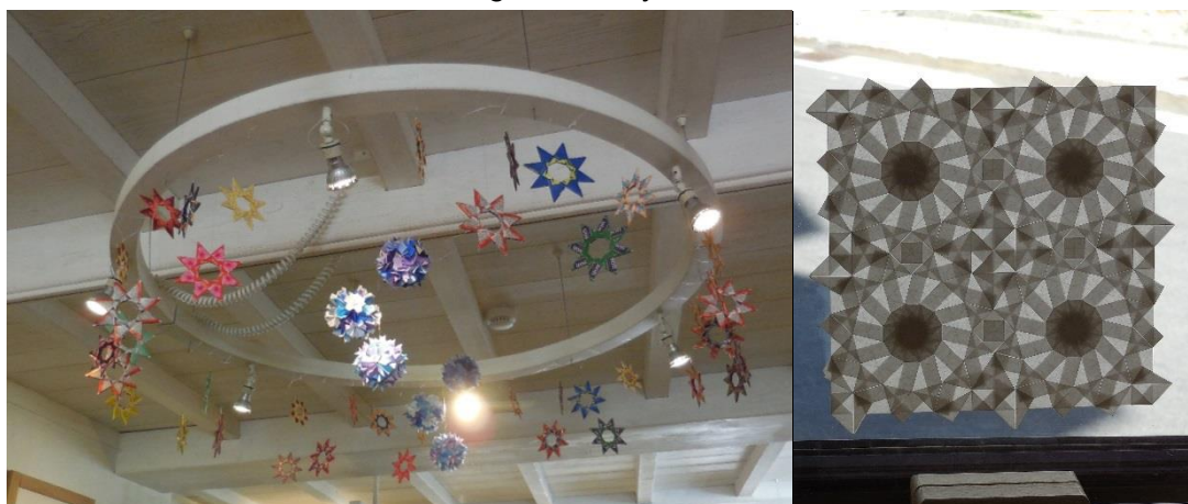
Mountain Folding 2014 – ... i wystawa origami w całej okolicy ...