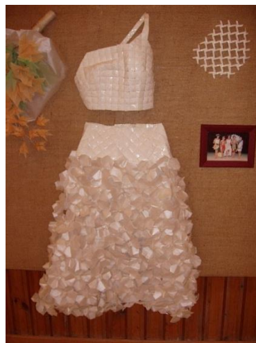
Origami Camp Magyaregregy 2004 – Origami