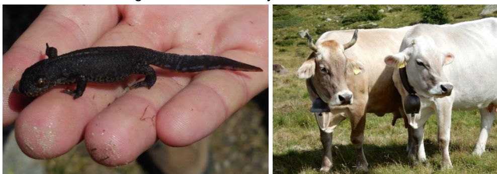
Mountain Folding 2014 – ... i spotykaliśmy różne zwierzęta

Strona internetowa Mountain Folding: http://mountainfolding.altervista.org/en/ https://www.facebook.com/MountainFolding