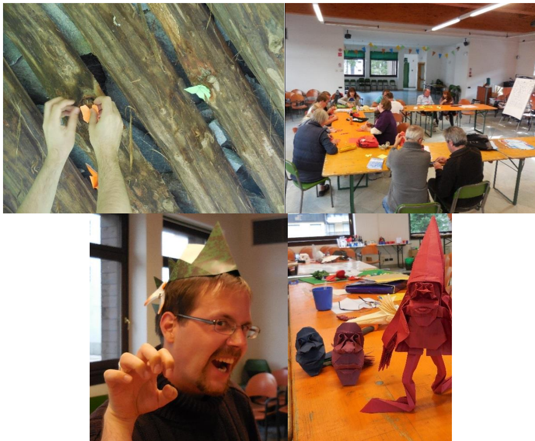
Mountain Folding 2014 – było dużo składania ...

Mountain Folding nie jest imprezą komercyjną, nie mamy sponsorów, ani funduszy, więc musimy pobierać opłatę konferencyjną. Jest ona przeznaczona na pokrycie kosztów organizacji oraz zakup papieru i innych materiałów, każdy z uczestników otrzyma także pakiet papierów dobrej jakości i kilka gadżetów. Jeśli pozostaną jakieś fundusze zostaną przeznaczone na kawę lub w inny sposób na potrzeby uczestników.