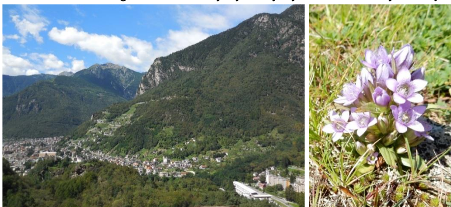
Mountain Folding 2014 – Widzieliśmy ładne widoki i ładne kwiatki ...