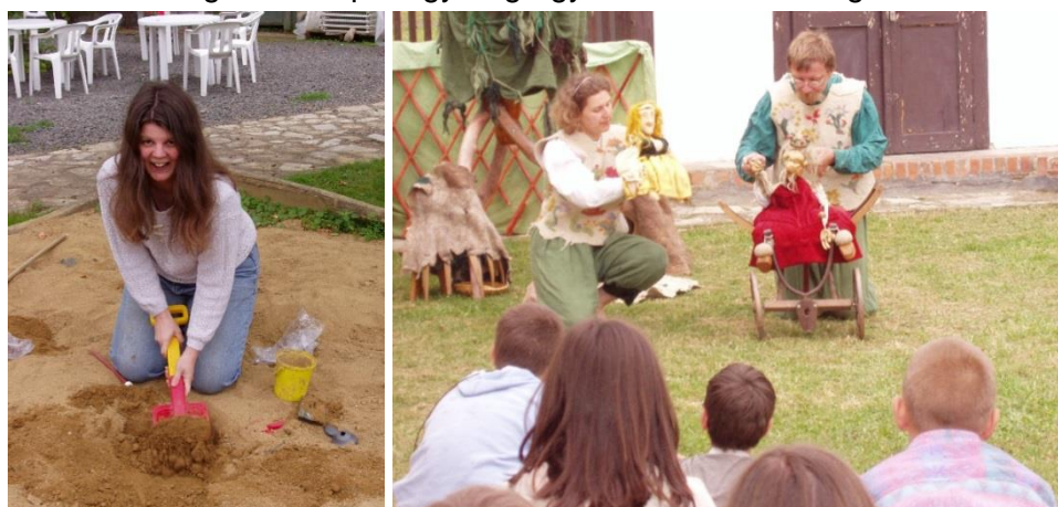
Origami Camp Magyaregregy – Nie całkiem origami

W tym roku obóz odbędzie się w dniach 28.06-02.07 (niedziela-piątek) . Tematem przewodnim będą tradycje japońskie: ikebana, furoshiki i podobne .