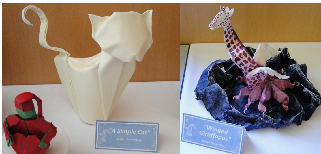
Daniel Chang: A Simple Cat (Prosty kot), Winged Giraffopus (Skrzydłata żyrafośmiornica), wystawa towarzysząca konferencji Origami Deutschland, 2014