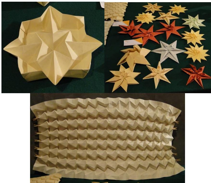
Prace wystawiane przez Ilana na konferencji CDO we Włoszech (2012)