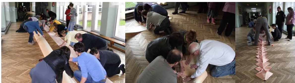
Herkulesowa praca wre

Ponieważ ślęczenia nad siatkami tesselacji o rozstawie 2mm jest niezdrowe dla oczu i kręgosłupa, uczestnicy Pleneru zmierzali się z czymś o zupełnie innych rozmiarach. Była to niewątpliwie jedna z prac na miarę Herkulesa, mianowicie przyniesienie pasa Hipolity. Konkurencyjne zespoły stały przed nie lada wyzwaniem spowodowanym zarówno rozmiarem papieru jak i koniecznością porozumiewania się w kilku językach. Ale rezultaty były imponujące – zobaczcie sami na zdjęciach poniżej.