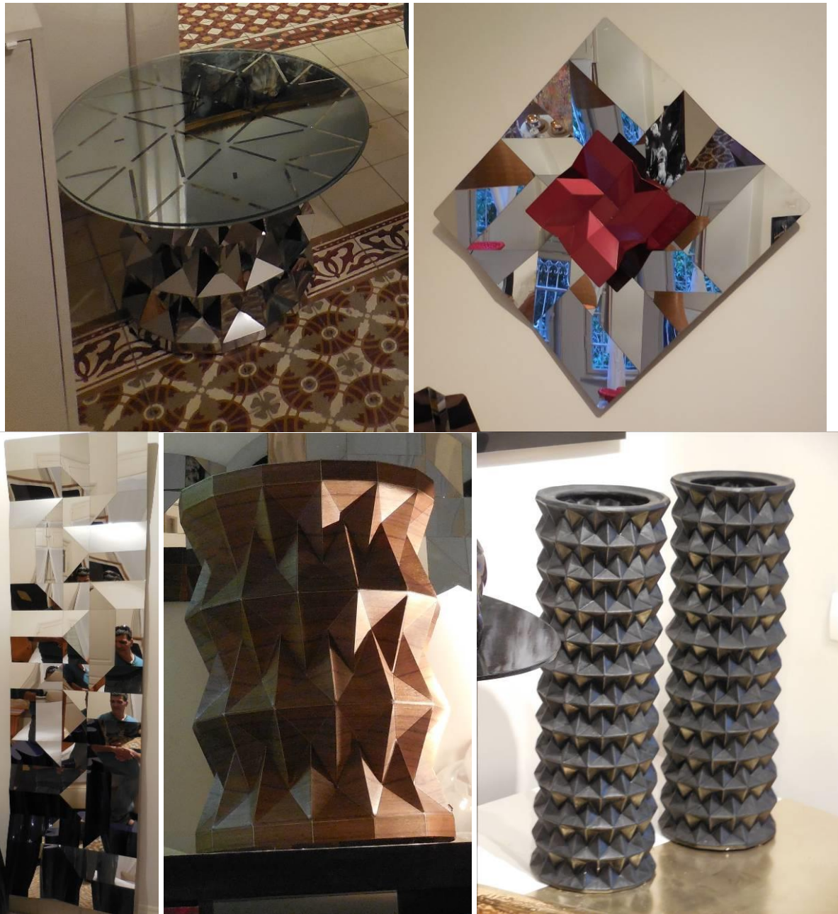
Prace w drewnie, betonie i metalu

W swoich poszukiwaniach artystycznych wychodzi poza kanon papieru jako materiału, respektując jednocześnie podstawowe zasady sztuki origami i bazując na zagięciu jako podstawowej technice artystycznej. Swoje prace tworzy z jednej strony z tkanin, z drugiej z metalu lub drewna. W swojej działalności artystycznej rozszerza zakres origami tworząc także sztukę wykorzystującą origami, choć nie będącą origami w ścisłym sensie. Przykładem takich prac są betonowe obiekty odwzorowujące strukturę modelu origami.