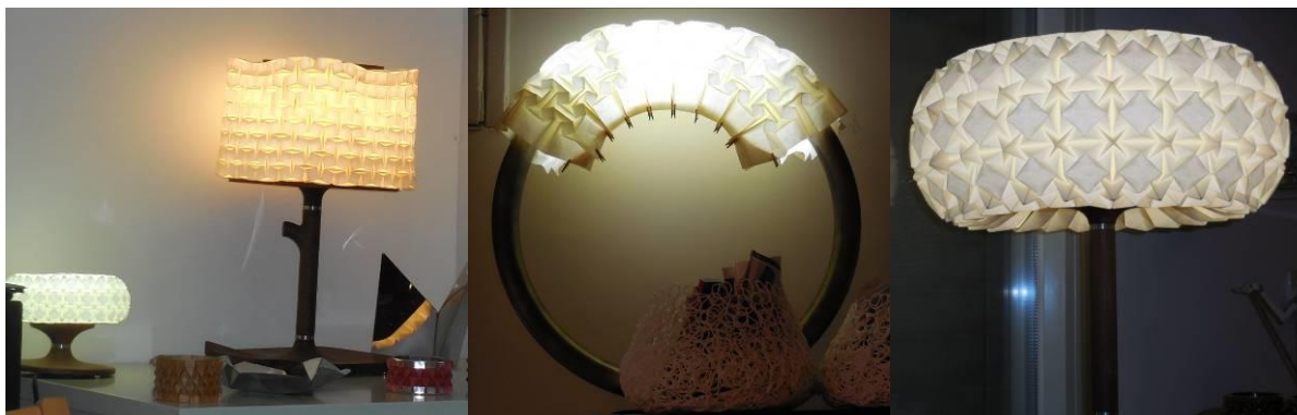
Projekty lamp Ilana Garibi

Ilan próbuje swoich sił także w dziedzinie wzornictwa przemysłowego. Z sukcesem sprzedaje lampy wykorzystujące wzory jego prac.