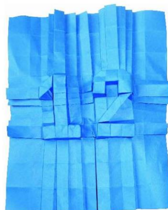
Galiczyńska Grupa Origami