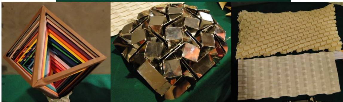
Prace wystawiane przez Ilana na konferencji CDO we Włoszech (2012)