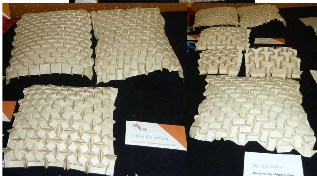
Prace wystawiane przez Ilana na konferencji AEP w Hiszpanii (2012)