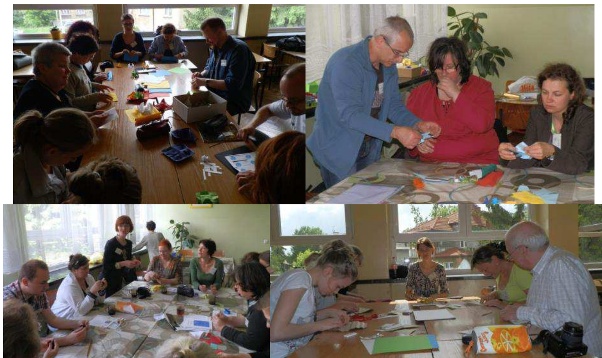
Migawki z warsztatów

Wszystkie warsztaty, niezależnie od stopnia trudności były bardzo dobrze przygotowane i prowadzone w przystępny sposób, czemu sprzyjały niewielkie grupy uczestników. Po raz kolejny potwierdziło się, że język nie jest przeszkodą. Na Plenerze słychać było język angielski, niemiecki, włoski, węgierski i polski, ale nie było żadnych problemów z komunikacją i wymianą poglądów. Kameralna atmosfera sprzyjała wymianie poglądów i praktycznie przez cały czas Pleneru trwały w mniejszych i większych grupach dyskusje o składaniu papieru i traktowaniu origami jak sztuki.