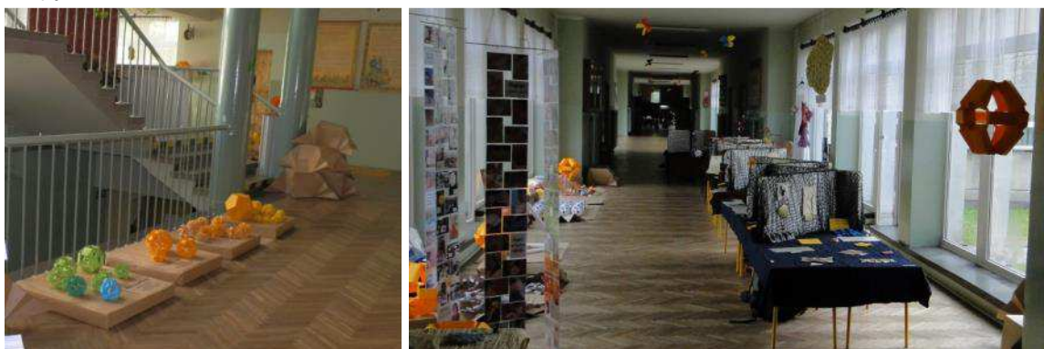
Rzut okiem na wystawę