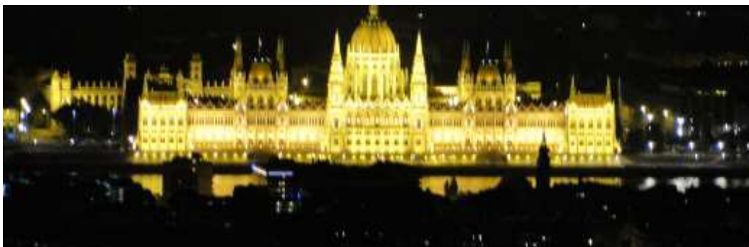
Nocny widok na Parlament