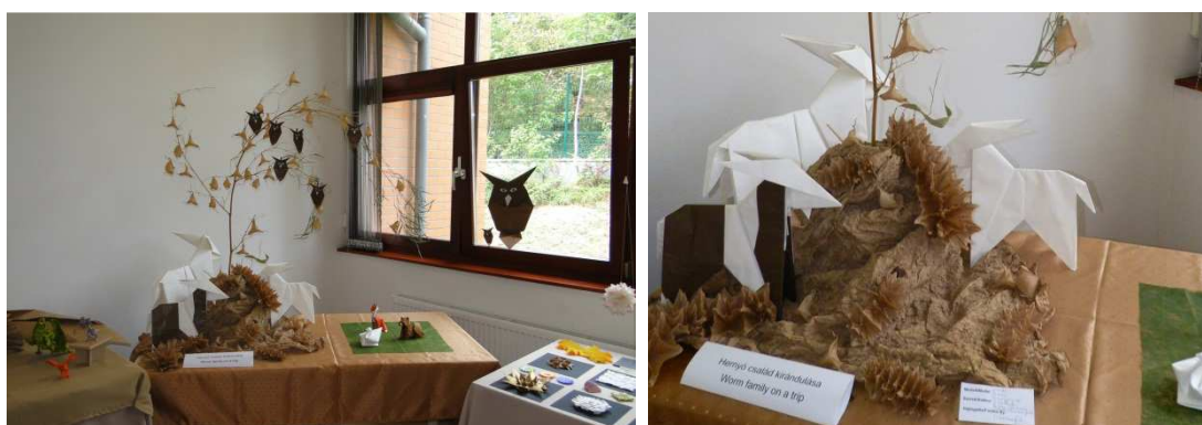
Aranżacja Paula Hassenfordera: Worm Family on a trip.