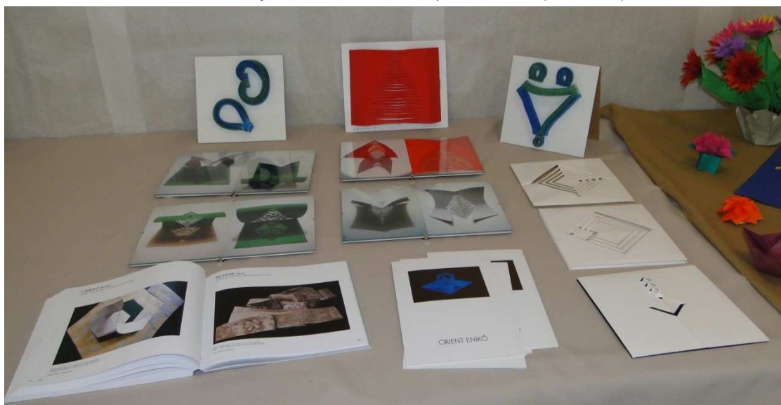
Prace Enikő Orient