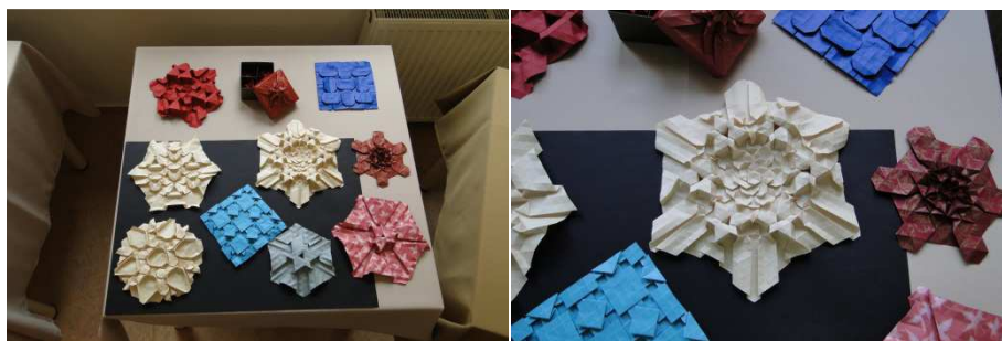
Prace Endre Somos'a