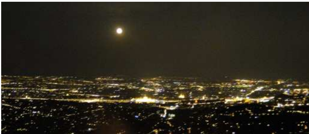
UFO nad nocnym Budapesztem