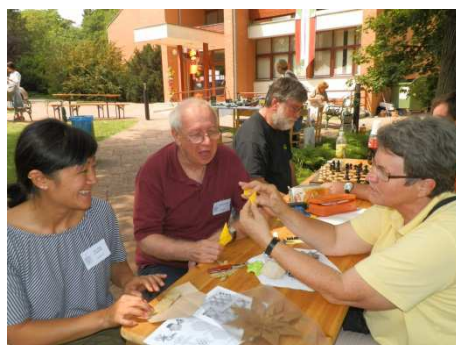
Free folding na świeżym powietrzu.

Jak to zawsze bywa na Węgrzech, nie mogło zabraknąć atrakcji wieczoru. Tym razem było to nocne składanie dla upamiętnienia ofiar Hiroshimy. Składaliśmy w najwyższym punkcie Budapesztu zapewniającym oszałamiające widoki.