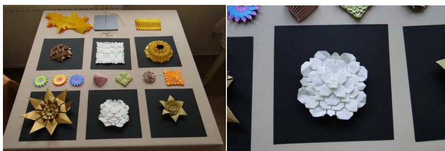
Modele różnych autorów złożone przez Claudię Maroskę.