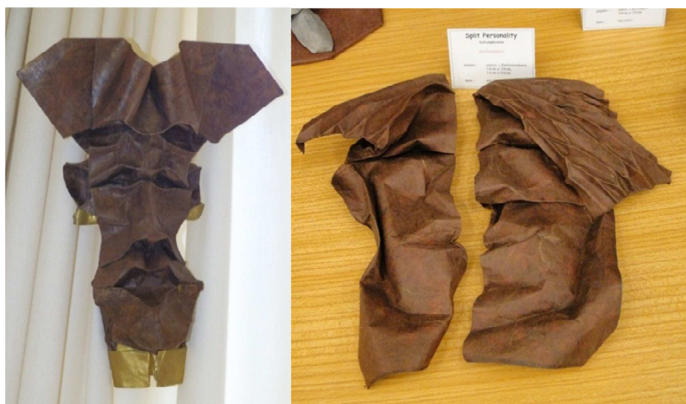
Wystawa: Gachepapier: Maska (po lewej), rozdwojenie jaźni (po prawej)