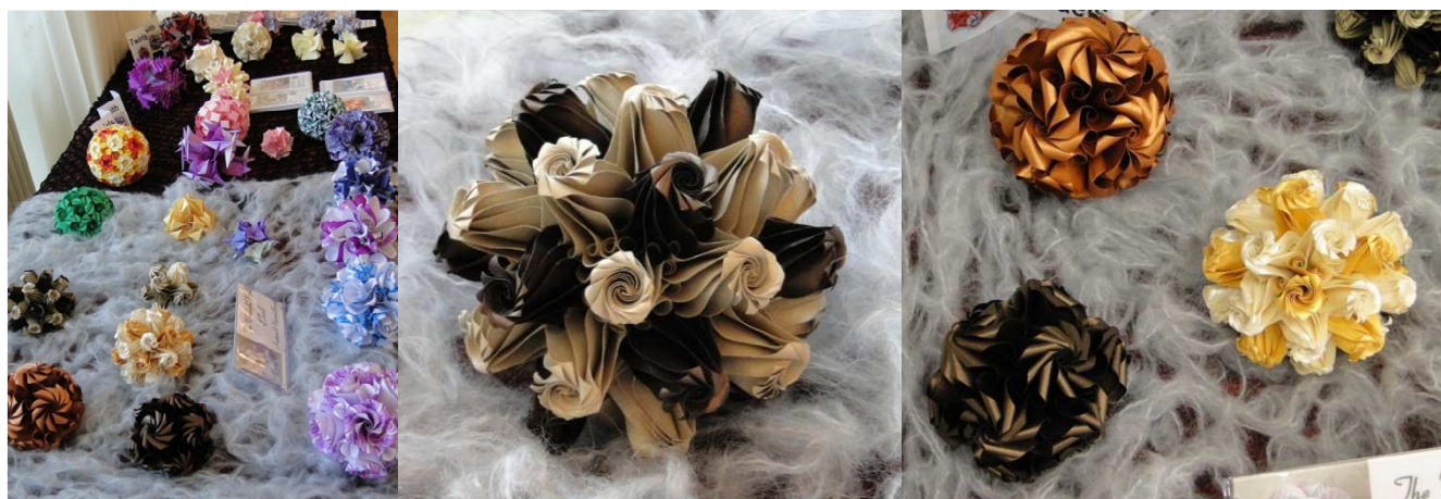
Nasza wystawa: Kręciołki, wybór projektów z 2012 roku.