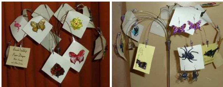
Broszki wykonane przez Marca Kennedy'ego (USA), prezenty dla uczestników jednego z Plenerów Origami