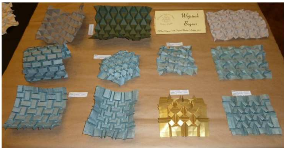
Wojciech Bogacz – Tesselacje.

Biżuteria origami była jednym z motywów przewodnich Pleneru. Stąd na wystawie można było zobaczyć przykłady modeli stanowiących biżuterię. Od biżuterii jednorazowego użytku, poprzez broszki, kolczyki i wisiorki utrwalone do długotrwałego użytku do artystycznie wykonanych kolczyków.