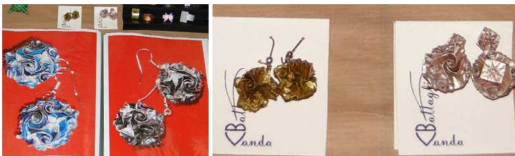
Kręciółkowe kolczyki wykonane przez Vandę Battaglię (Włochy) na podstawie projektów Krystyny Burczyk

Szkoła zapewniła nam bardzo dużą salę na wystawę modeli. Było dość miejsca, aby wyeksponować modele każdego z uczestników w praktycznie nieograniczonych ilościach. Przed omówieniem modeli zapraszamy do panoramicznego spojrzenia na całą wystawę.