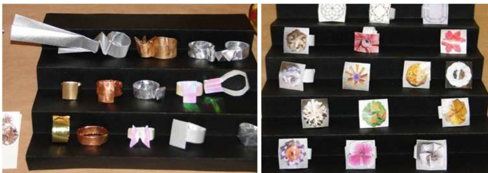
Przykłady pierścieni origami (modele złożone przez Krystynę Burczyk)

Biżuteria origami była jednym z motywów przewodnich Pleneru. Stąd na wystawie można było zobaczyć przykłady modeli stanowiących biżuterię. Od biżuterii jednorazowego użytku, poprzez broszki, kolczyki i wisiorki utrwalone do długotrwałego użytku do artystycznie wykonanych kolczyków.