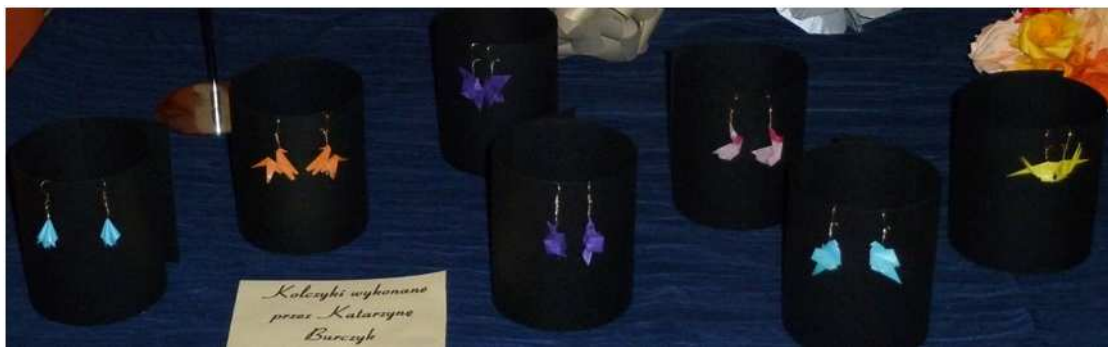
Kolczyki wykonane przez Katarzynę Burczyk