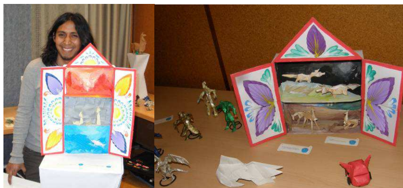
Modele Mette Pederson