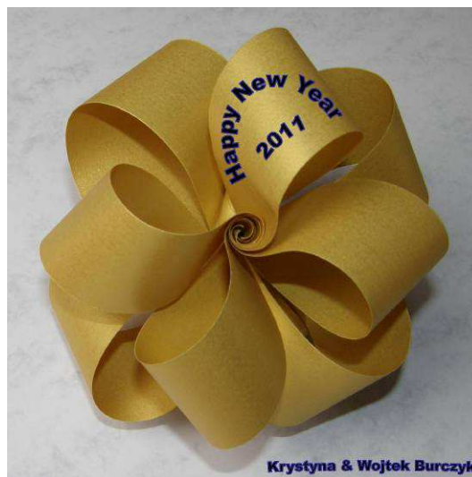
Krystyna & Wojtek Burczyk

Odrabiam też zeszłoroczne zaległości relacją z konferencji w Bonn